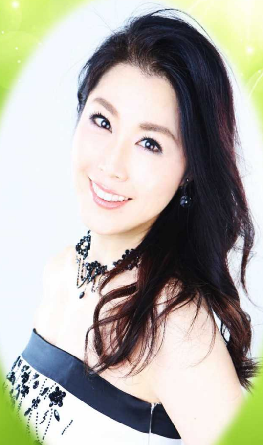
ソプラノ 赤池優 Soprano / Akaike Yu